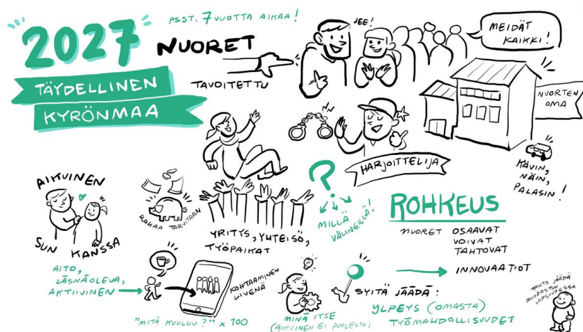
Kuva2. Nuorten näkökulma osallistavaan työskentelyyn vuonna 2027. Tussitaiturit

Kyrönmaan sijainti kahden maakunnan alueella, maakuntakeskusten kupeessa, tarjoaa edellytykset maaseutumaiselle asumiselle rikkaassa kulttuuri- ja luontoympäristössä. Pienen alueen lähipalvelut ja kulttuuriympäristöjen ylläpito ja monipuolinen käyttö edellyttää innovatiivisia ja yhteisöllisiä ratkaisuja. Kylätaloja ja nuorisoseuroja kunnostetaan sekä toimintaa aktivoidaan esim. tapahtumien, kurssien, näyttösten, tanssien ja yhteisruokailujen muodossa. Tiloja kehitetään myös etätyöntekijöiden ja yksinyrittäjien sosiaalisina tiloina, mikä edellyttää hyviä tietoliikenneyhteyksiä ja saavutettavuuden parantamista esim. varauskalenterin avulla.