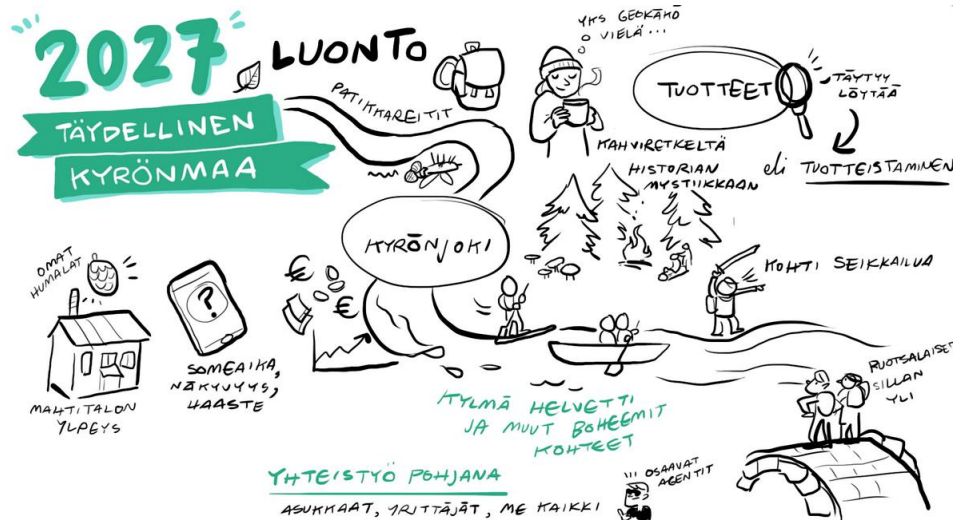
Kuva. Yhteistyö luontoarvojen hyödyntämisessä vuonna 2027. Tussitaurit

Tavoitteena on luoda fiksusti verkostoitunut ja omiin vahvuuksiin nojaava alue, joka tukee uuden osaamisen ja ratkaisujen kehittämistä ja soveltamista. YHYRES ry rakentaa aktiivisesti yhteistyötä oppilaitosten ja yritysten, kylien ja yhdistysten, kuntien ja kaupunkien sekä muiden toimijoiden kanssa. Yhteistyö ulottuu myös alueen houkuttelevuuden vahvistamiseen alueellisten, kansallisten ja kansainvälisten toimijoiden kanssa.